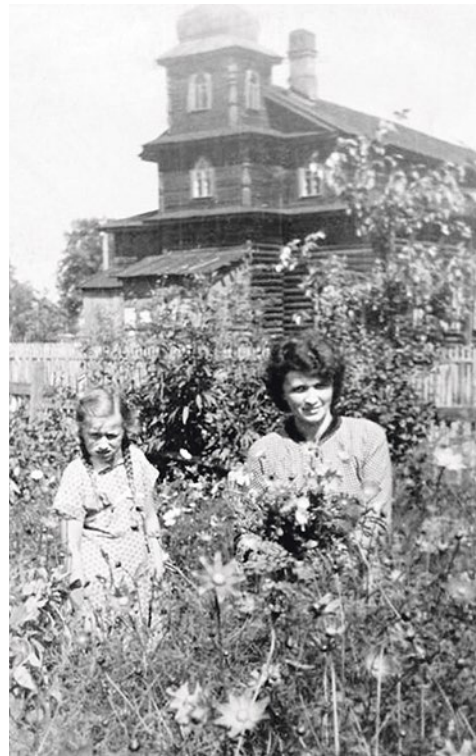
Молельный дом. Конец 1930-х гг.

Старый молитвенный дом обветшал, и в 1909 году колонисты написали в губернскую управу прошение – выстроить на своей земле «новую деревянную одноэтажную школу-молитвенный дом с холодным досчатым мезонином». Городские власти запретили устраивать молельню в школьных стенах. Тогда колонисты зачеркнули на плане крест, и проект был согласован. А вскоре здание «капитально отремонтировали» – над входом появилась башенка колокольни, а окна стали стрельчатыми, как в готическом храме.