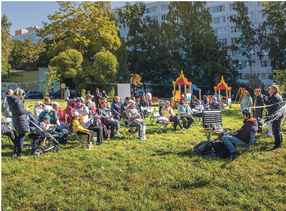
Жители муниципалитета № 72 учатся создавать красоту во дворе

Как уютны наши дворы! Весной купаются в яблонецвете, летом утопают в зелени, до самого снега благоухают цветами. И всю эту красоту создали сами жители – сажали деревья, разбивали палисадники, украшали балконы. Люди и растения пускали корни, и они незаметно сплелись в одно целое, в то, что мы зовем «малая родина».