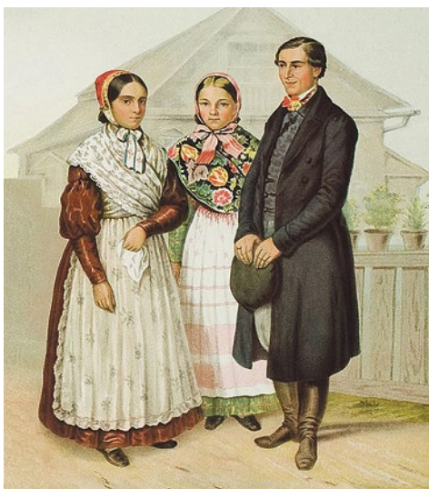
Немецкие колонисты из окрестностей Санкт-Петербурга

В 1877 году в колонии был построен первый лютеранско-евангелический молитвенный дом со школой. Своего священника не было, и прихожане молились сами. Несколько раз в год их навещали пастор и проповедник из Новосаратовки, а по важным праздникам колонисты ездили на правый берег Невы, в кирху Святой Енатины.