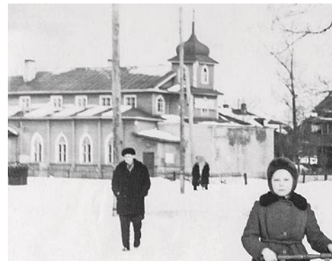
Кирха на фото 1960–1961 гг.

В 1914 году началась Первая мировая война, и в немцах стали видеть врагов и шпионов. Немецкие школы закрывали, а людей вынуждали покинуть Россию. Зато революция была благосклонна к малым народам. Школа была отделена от церкви, но кирхи продолжили работу, а дети из верующих семей проходили обряд конфирмации. В 1921 году в Ново-Александровской школе появились театральный и музыкальный кружки, а взрослые слушали лекции о науках и сельском хозяйстве. В конце 1920-х годов колония уже была крупным поселком – здесь жило 793 человека, из которых 256 были немцами.