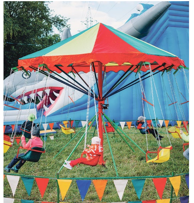
Злаковое поле стало похоже на сельскую ярмарку – широкую, разудалую, шумную

не поставили в тупик: Купчино – интеллектуальная столица, а вы не знали?