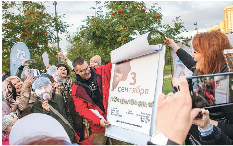
Праздник «Костры рябин» решили сделать ежегодным

Муниципалитет № 72 не смог остаться в стороне и решил: праздновать – так всем вместе! 2 сентября, накануне знаменательной даты, в парке Интернационалистов состоялся флешмоб «Костры рябин». Здесь были и огромный