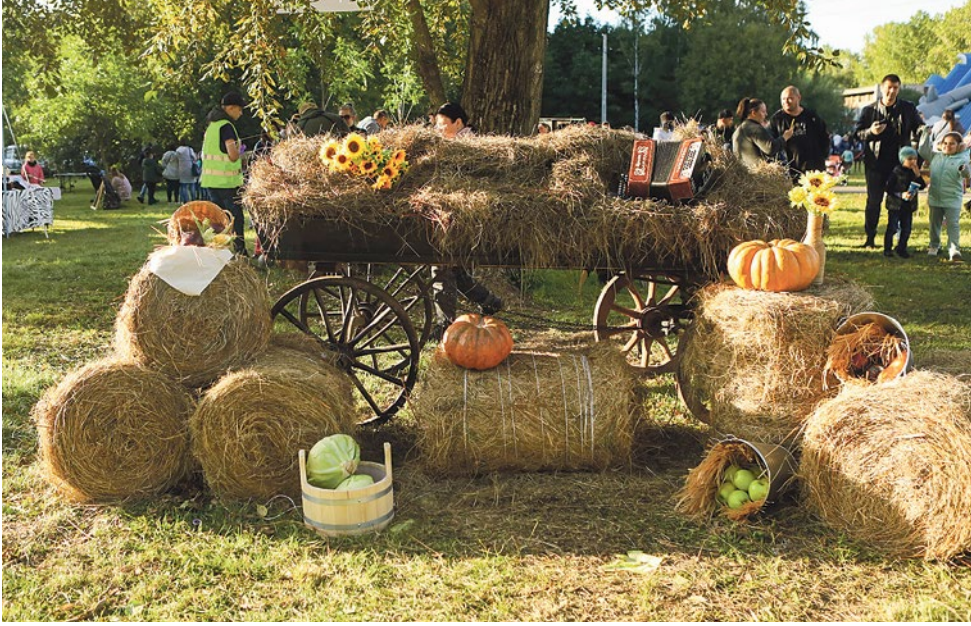
«Капустный» фестиваль надолго запомнится купчинцам