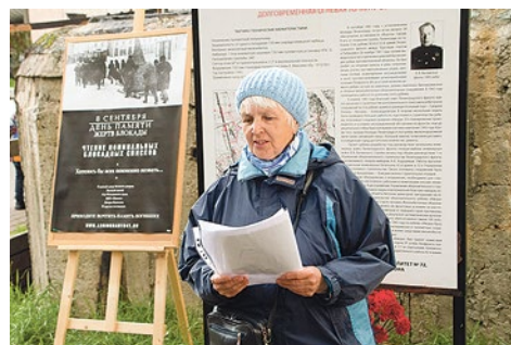
Ежегодная акция «Блокадные чтения» у ДОТа № 20 оборонительного рубежа «Ижора»

с теми, чья жизнь была оборвана войной, отдать им дань уважения.